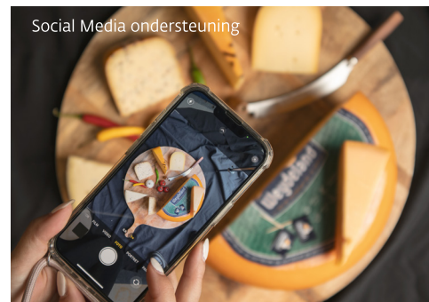
Social Media ondersteuning